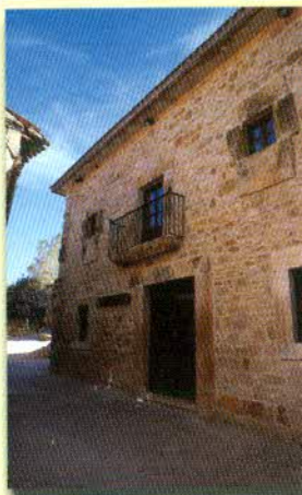
Museo Sonidos de la Tierra