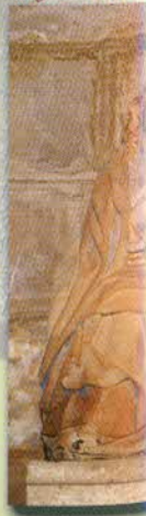
Virgen de la leche