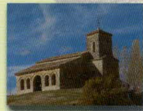
Ermita mozárabe de Santa Cecilia

La especialidad por excelencia es el "Cabrito Asado", que se prepara a la manera tradicional, además del rico embutido casero, verduras naturales y sopa castellana. También se pueden degustar carne de vacuno y de caza de la Sierra de la Demanda y truchas de río. Acompañado por los vinos de la Ribera del Duero o de la Ribera del Arlanza. Y el postre, la guinda de la comida puede ser, arroz con leche, natillas, tartas caseras o el postre del abuelo (queso de Burgos con nueces de Silos y miel de espliego).