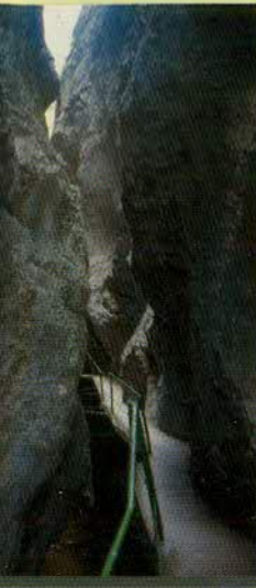
Desfiladero de la Yecla